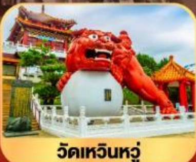
วัดเหวินหนู่