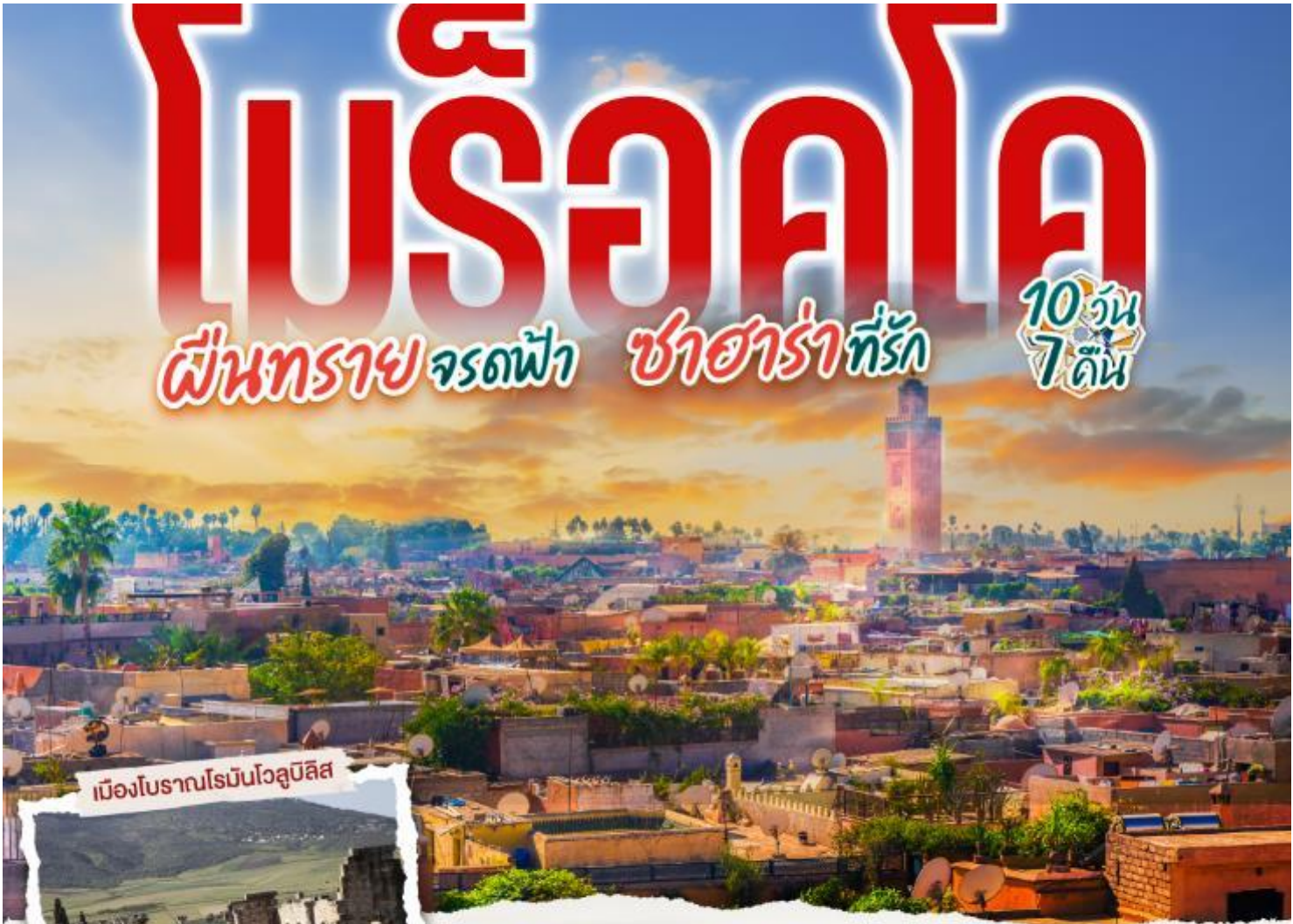
เมืองโบราณโรมันโวลูบิลิส