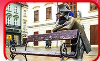
ย่านเมืองเก่า Bratislava

เที่ยวเมืองสวยริมทะเลสาบ ฮัลล์สตัดท์ • ชมเมืองไข่มุกแห่งโบฮีเมีย เซสกี กรุงลอน • ปราก • เวียนนา • ซอปปิงพาร์นดอร์ฟ เอาก์เล็ท