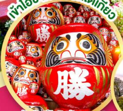
วัดคัตสึโอจิ (วัดดาร์มมะ)