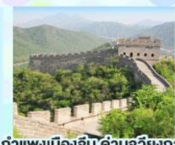
ตลาดร้อยปีเจิ้งหวิงเมี่ยว กำแพงเมืองจีน ด้านจวิยงทวน