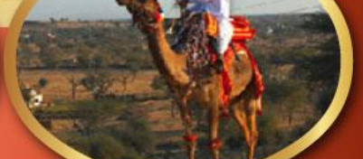
ฟรี จักรู เมืองมันทาวา ราคาเริ่มต้น