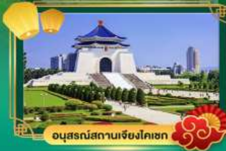
อนุสรณ์สถานเจียงไคเชก