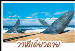
วาฬยัดขวิดตาย