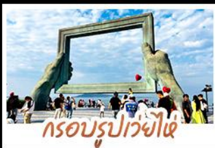
กรอบรูปเว่ยไห่

ทำรูปย่านเมืองเก่าสไตลียอร์มัน • โบสถ์ซันติไมเคิล และย่านป่าดึกทวน พร้อมทัวร์พิพิธภัณฑ์โรงเบียร์ชิงเต่าระดับตำนาน ฟรี! ซิมเบียร์สดทำนอง 1 แก้ว เช็คอินแมนหาชมฟลอมบี้เบเกอรี่กับคอปเพิลิงสายที่ 8 • แวะทำรูปสุดอาร์ตกับ ซากเรือลูนวีย์ • ตกค่ำดูของกินที่ตลาดสไตลียอร์มัน ถนนอันเลื่องชื่ เที่ยวอิสระ-ตามใจชอบ จัดสรรเวลาให้ท่านด้วยวัน FREE DAY 1 วันเต็มในชิงเต่า