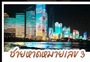
ซ่าชายหาดมาเจลเลข 3