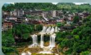
หมู่บ้านฟุ่หลงเจิ้น