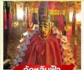
วัตต์หลินฟ้า