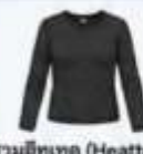
สวมฮีทเทค (Heattech) แบบหนาพิเศษด้านใน