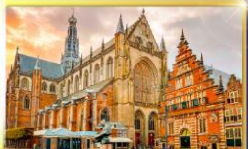
จัตุรัสเมืองฮาร์ลิม

ชมแคนเมืองแปลกเนเธอร์แลนด์และเบลเยียม เดินเมืองเคลฟท์ เมืองเครื่องปั้นดินเผาระดับโลก ฮาร์ลิมเมืองมั่งคั่งที่สุดของเนเธอร์แลนด์