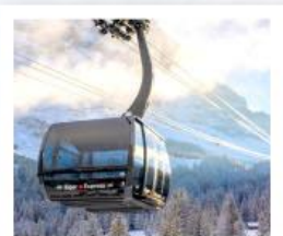
ขึ้นกระเช้ายอดเขาจุงเฟรา