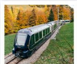
รถไฟโกลด์นพาส