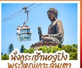
นั่งกระเช้าแองปัง พระใหญ่เกาะคิมเตา