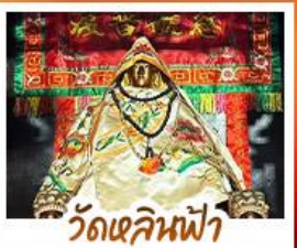
วัดเสียนฟ้า