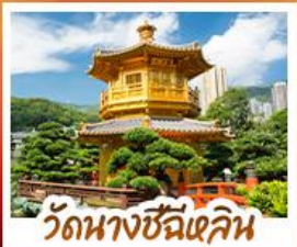
วัดนางชีฉีเสียน