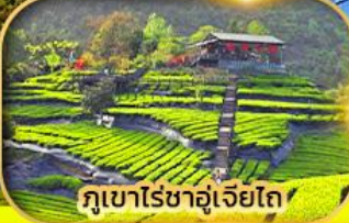
ภูเขาโรซ่าอู๋เจียโถ