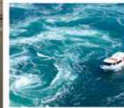
คลองเรือขมบ้านนาสุโตะ

คลองเรือขมบ้านนาสุโตะ / ซุปบึงย่านชินโซบาช / ตลาดปลาคุโรเมง / ซุปบึงย่านอุมาโตะ