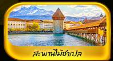
สะพานไมซ์าเปลา