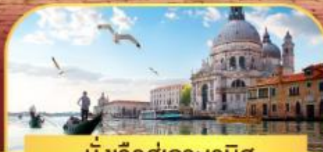
นั่งเรือสุทเทาะเวนิส