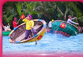
ส่องเรือกระดัง หมู่บ้านกิมทาน