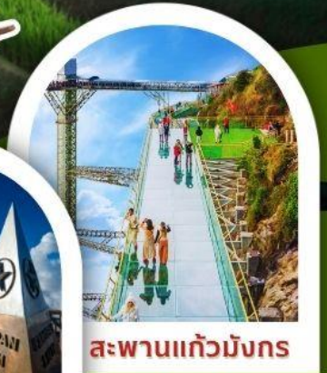
สะพานแก้วมิงทง