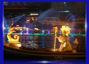
ชมโชว์เวนิสจำลอง แกรนด์วิลด์