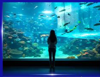
อควาเรียมยักษ์รูปเต่า