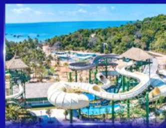
สวนสนุก Sun world Hon thom