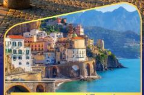
ชมวิวมอลฟีโคสก์