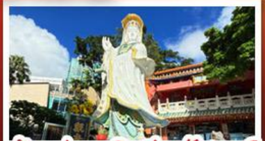
เจ้าแม่กวนอิมรัฟลัสเบย์