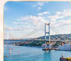
BOSPHORUS STRAIT ช่องแคบบอสฟอรัส