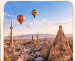
CAPPADOCIA คัปปาโดเกีย