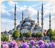
BLUE MOSQUE สุเหร่าสีน้ำเงิน