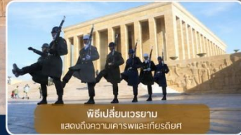
พิธีเปลี่ยนเวรยามแสดงต้นความเคารพแก่เกียรติยศ

ได้เวลาเดินทางทางสู่เมือง "ซาฟรานโบลู" (Safranbolu) คือเมืองท่องเที่ยวที่มีชื่อเสียงของจังหวัดการาบึค (Karabük) ในภูมิภาคทะเลดำตุรกี เป็นเมืองที่มีความสำคัญทางด้านประวัติศาสตร์ของประเทศ ตุรกี โดยเฉพาะชื่อเสียงเกี่ยวกับสถาปัตยกรรมซาฟรานโบลู ที่มีอิทธิพลต่อพัฒนาการชุมชนเมืองทั่วทั้งจักรวรรดิออตโตมัน ต่อมาในปี 1994 เมืองซาฟรานโบลู ได้ถูกองค์การยูเนสโกยกให้เป็นมรดกโลกทางด้านวัฒนธรรม