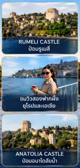
RUMELI CASTLE ป้อมรูเมลี

สัมผัสเสน่ห์อันงดงามของอิสตันบูลจากผืนน้ำ