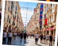
ISTIKLAL STREET (Grand Avenue of Pera) ถนนสายช้อปปิ้ง ยืน 88 ตรอกซอยในทีเดียว