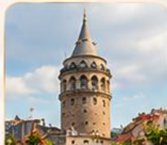
GALATA TOWER หอคอยกาลาตา