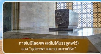
ภายในมิสึคอฟ (แต่ไปไม่ถึงจุดฟรี) ของ "มุสตาฟา เคมาล อะตาเติร์ก"