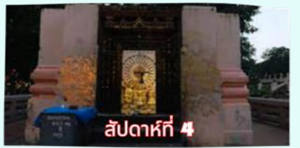
รัตนขรรเจดีย์ (ซุ้มเรือนแก้ว)

เรียบร้อยแล้ว นำคณะจาริกบุญสวดมนต์ทำวัตรเย็น บูชาพระรัตนตรัย และสวดมนต์บูชาสังเวชนียสถาน จากนั้นเชิญท่านทัศนารธรรม นั่งสมาธิปฏิบัติบูชาตามอัยาศัย สมควรแก่เวลา นัดหมายเวลาเชิญท่านกลับโรงแรมที่พัก