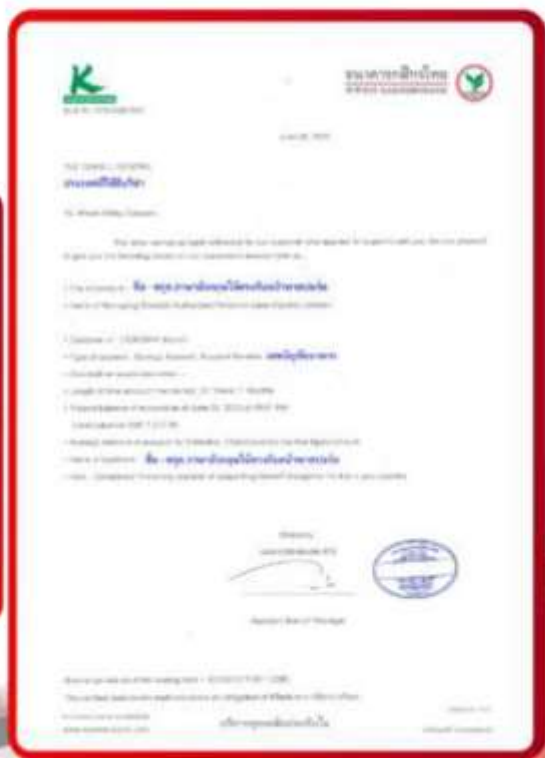
ตัวอย่าง Bank Guarantee ที่ผู้สมัครต้องขอเกี่ยวกับธนาคาร