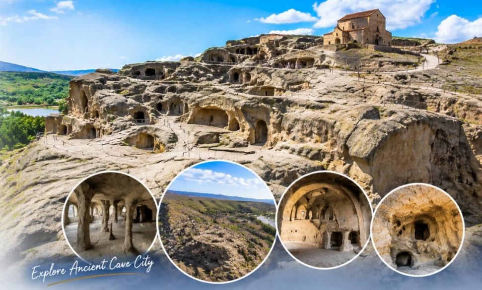
Explore Ancient Cave City

นำท่านเดินทางสู่เมืองคูไตซี (Kutaisi) (ประมาณ 145 กม./1.50ชม.) เมืองนี้มีความเจริญเป็นอันดับสองรองจากทบิลีซี ชมความสวยงามของเมืองคูไตซี ซึ่งมีชื่อเสียงทางด้านวัฒนธรรมและได้รับการขึ้นทะเบียนให้เป็นมรดกโลก ซึ่งถ้าย้อนกลับไปเมื่อสมัยศตวรรษที่ 12-13 ได้เคยเป็นเมืองหลวงเก่าแก่ของอาณาจักรโคลคลิส (Empire of Colchis) และอาณาจักรอิเมรีย (Kingdom of Emetria) ที่อยู่ทางด้านของตะวันตกของประเทศ