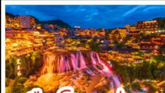
เมืองโบราณฟูหรง

เมืองโบราณฟิ่งหวง - เมืองโบราณฟูหรง หงหยาดัง - ประตูลั่วจื่อ - รถไฟทะลุคด