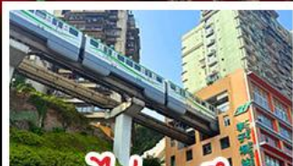
รถไฟทะลุคด