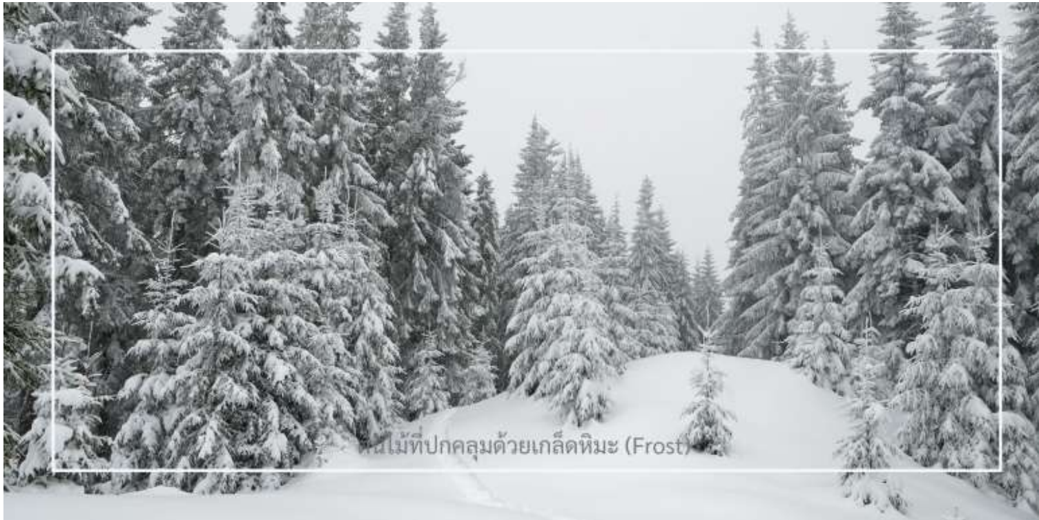
ต้นไม้ที่ปกคลุมด้วยเกล็ดหิมะ (Frost)

ยาบูลี (Yabuli) เมืองตากอากาศชื่อดังทางตอนเหนือของจีน ตลอดเส้นทาง ท่านจะได้เพลิดเพลินกับทัศนียภาพของฤดูหนาวที่งดงาม ราวกับฉากในนิยาย ท่ามกลางต้นไม้ที่ปกคลุมด้วยเกล็ดหิมะ (Frost) ระเบียบระย้าขาวคริสตัล สองข้างทางแต่งแต้มไปด้วยหิมะขาวนวล เป็นบรรยากาศที่หาได้ยากและงดงามจับใจในแบบเฉพาะของดินแดนภาคตะวันออกเฉียงเหนือของจีน