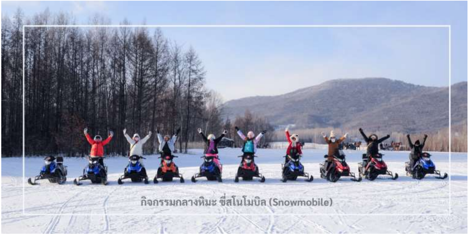
กิจกรรมกลางหิมะ ซึสโนโมบิล (Snowmobile)

สมควรแก่เวลานำท่านเดินทางสู่เมือง มู่ตันเจียง (Mudanjiang) ใช้เวลาเดินทางประมาณ 2 ชั่วโมง มู่ตันเจียง เมืองสำคัญตั้งอยู่ใกล้พรมแดนรัสเซีย ห่างไปทางตะวันตกประมาณ 110 กิโลเมตร เมืองนี้มีเอกลักษณ์วัฒนธรรม และสถาปัตยกรรมที่ผสมผสานระหว่างรัสเซียและจีน โดยเฉพาะในฤดูหนาวเมืองจะถูกปกคลุมด้วยหิมะขาวโพลน