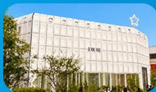
บรักคินกาหลี่