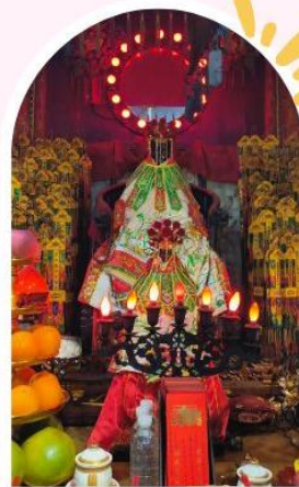
วัดเจ้าแม่กวนอิมฮ่องฮำ ขอพรเรื่องเงิน ทรัพย์สิน และความมั่งคั่ง