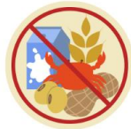
● แพ้อาหาร / อื่นๆโปรดระบุ