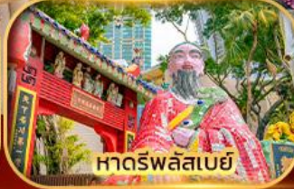
หาดรพลัสเบย์