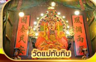
วัดแม่ทับทิม