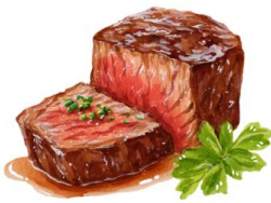
● เนื้อวัว

ขอความกรุณาแจ้งวัตถุประสงค์ที่ท่าน แพ้หรือไม่สามารถรับประทานได้