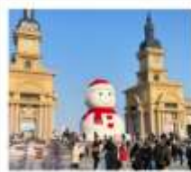
ตุ๊กตาหิมะยักษ์

โบสถ์ซันไฮเซย์ / ฤดูหิมะวอดการ์ / โบสถ์ซันตปีทริค / Harbin Polar Park หมู่บ้านหิมะ: SNOW TOWN + กิจกรรมสาดน้ำร้อนกลางแจ้ง / เซาเปียงตง DREAM HOME (รวมค่าเช่า) / สนแสดงตีกองกิมกอนเซ่เม่เจีย + สวนพลาเทอดิสที่ กาฬเจียน ICE AND SNOW (ฟรี Snow Tubing ท่าละ: 1 รอบ) ถนนหงหยาง (ฟรี!! ไอศกรีมหน้าต๋อเอ๋อส์) / เกาะพระอาทิตย์ (รวมรถแบดเจอร์) Harbin 2027 International Ice and Snow Festival / หอไอเป่ร่าฮาร์บีน อุป๋นิงตุ๊กตาหิมะยักษ์ + ระเบียงฉนวนดี / ทะพานกระจอกไฟประวัธศาสด์