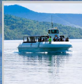
“LAKE SHIKOTSU GLASS BOAT”