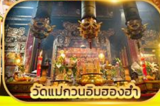
วัดแม่กวนอิมของฮ่า