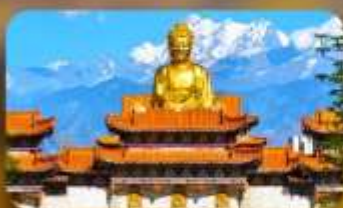
วัดพระใหญ่ทวงกงซาน