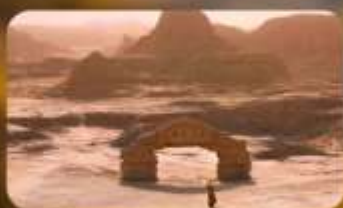
เมืองปีศาจ