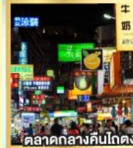
ตลาดกลางคืนโตง