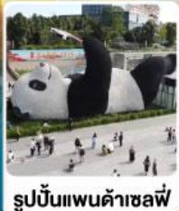
รูปปั้นแพนด้าเซลฟี