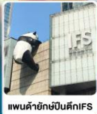
แพนด้ายักษ์ปีนตึกIFS