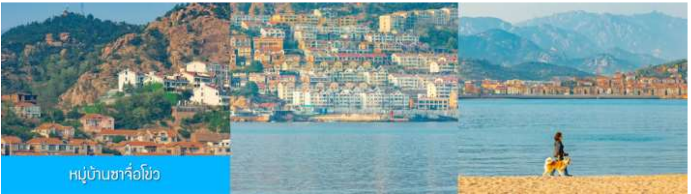
หมู่บ้านซาจื่อโข่ว

จากนั้นนำท่าน เดินทางสู่ คาเฟ่อีสต 落日古堡 นำท่านชมปราสาทในเทพนิยาย ที่ตั้งตระหง่านอยู่ริมชายหาด นานาชาติเว่ยไห่ คาเฟ่ที่ออกแบบด้วยสถาปัตยกรรมสไตล์ยุโรป ตัดกับวิวทะเลสีคราม และที่นี่คือแม่เหล็กดึงดูดนักท่องเที่ยวมาเก็บบรรยากาศความสวยงามความโรแมนติก (ตัวปราสาทเป็นร้านคาเฟ่ หากท่านต้องการเข้าไปด้านใน ต้องจ่ายค่าเครื่องดื่ม ตามเมนูของทางร้าน ซึ่งไม่รวมในอัตราค่าทัวร์)