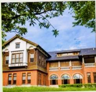
พิพิธภัณฑน์น้ำพุร้อนเป่ย์โถว