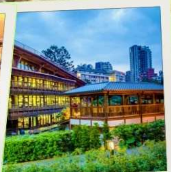
ห้องสมุดเป่ย์โถว