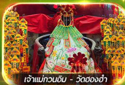
เจ้าแม่กวนอิม - วัดฮ่องกง