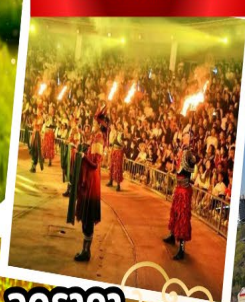
ปาร์ตี้รอบกองไฟ