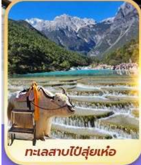
ทะเลสาบไป๋ซู่เหย่