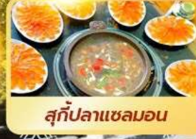
สุกี้ปลาแซลมอน