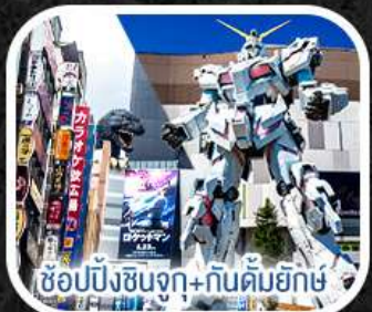
ช้อปปิ้งชินจูกุ + กันดั้มยักษ์