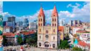
โบสถ์คริสต์เซนต์ไมเคิล

*ทางบริษัทฯ ขอสงวนสิทธิ์ในการสลับโปรแกรมทัวร์ตามความเหมาะสมขึ้นอยู่กับสถานการณ์หน้างาน โดยคำนึงถึงผลประโยชน์ของลูกค้าเป็นสำคัญ