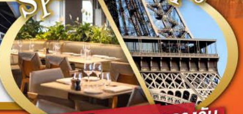
รับประทานอาหารกลางวัน บนหอคอไอเฟล