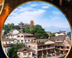
เมืองโบราณฉือจี้เป่