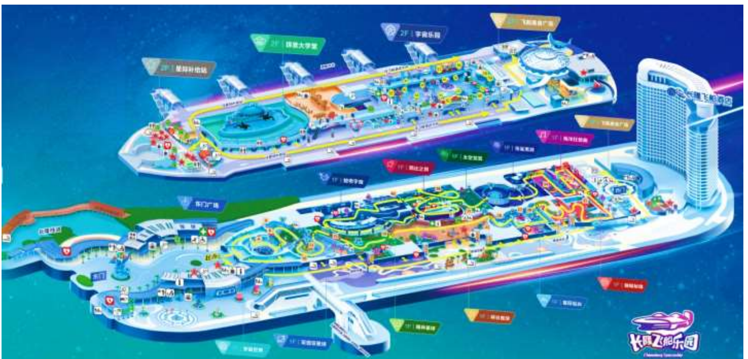
แผนที่ CHIMELONG SPACESHIP PARK